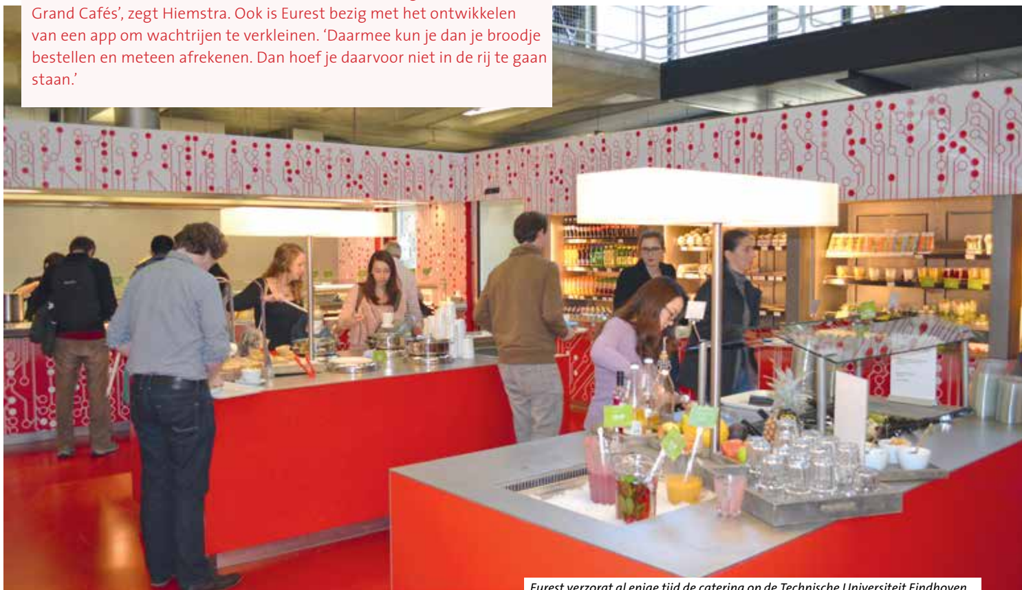
Eurest verzorgt al enige tijd de catering op de Technische Universiteit Eindhoven.

Dit jaar hebben al bijna zestigduizend studenten een boete gekregen. Per halve maand betalen ze 97 euro. Het totale bedrag aan boetes is nu al meer dan 37 miljoen euro. Ook in andere jaren blijken de boetebetalers gemiddeld zo'n drie maanden te laat. Alleen in 2012 waren ze een maand sneller, toen de boete werd verhoogd van 68 naar 97 euro per twee weken.