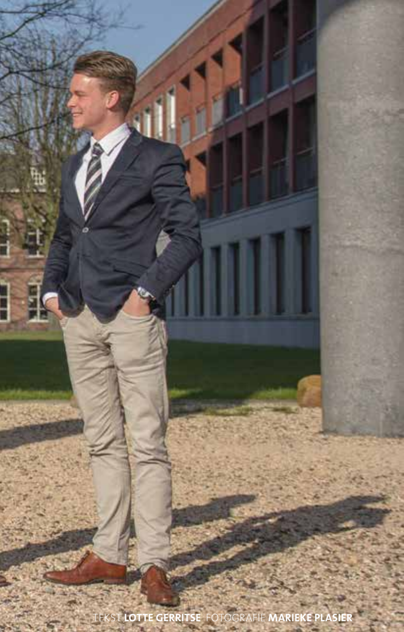
TEKST LOTTE GERRITSE

doen. Wel merken we dat ze soms hele kritische vragen op ons afvuren, maar die kunnen we altijd goed beantwoorden omdat we weten waar we het over hebben. Dat roept vaak sympathie op. Inmiddels hebben wij ook een ervaren vastgoedpartij achter ons staan en is er een notaris bij alle transacties betrokken. Dat maakt ons betrouwbaar.'